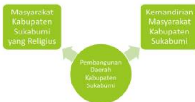
Gambar 1. Hubungan Antar Elemen Visi Pembangunan Kabupaten Sukabumi

Visi tersebut mengandung dua elemen penting dalam capaian pembangunan Kabupaten Sukabumi periode 2021-2026 yakni Religius, Maju dan Inovatif Menuju Masyarakat Sejahtera Lahir Batin. Dari dua elemen tersebut maka dapat ditelaah bahwa kepala daerah ingin membangun Kabupaten Sukabumi menjadi lebih baik dengan tetap mempertahankan moral religiusitas, maju dan inovatif serta masyarakat lahir batin seperti yang tergambar pada gambar berikut.